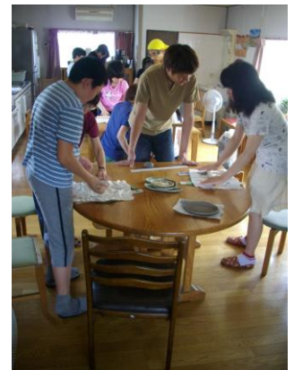
粘土をこねて お皿やリースのできあがり