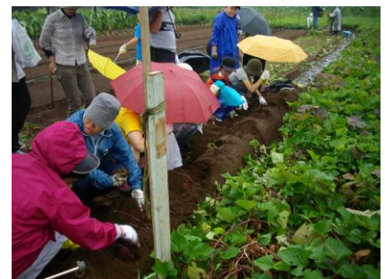
「掘り」 雨にたたられ大変でした