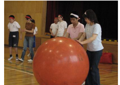
「大玉ころがし、 よーい・スタート」