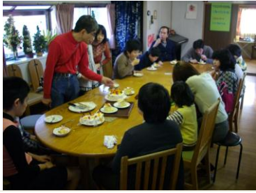
「メリークリスマス！」 手作りケーキで楽しい集い

演奏者の熱い思いが伝わってくる、 そんなアコーディオンの音色に心奪われ、 それぞれ体を動かしたり、メロディーに 合わせて声を出したり、全身で “音”を感じているかのような — それはおしゃれなコンサート —