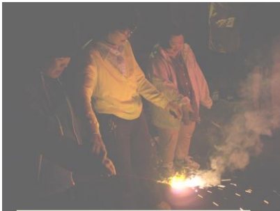
宿白での“夏の夜の風物詩”

築地にすし店は数あれど、 行列ができるのは限られた 数店舗のみ。中でも一番旨 いと評判の店で、40分並ん でお寿司を頂きました。評 判に違わぬおいしさで、メ ンバーもしばし言葉を失っ ていました。