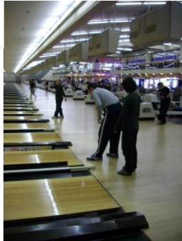
「めざせ、ストライク！」