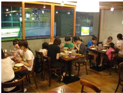
レストランでのおいしい夕食 — 宿白の夜 —