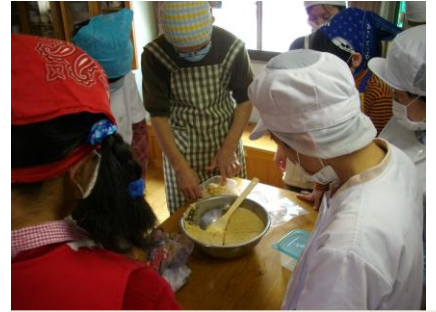
「おいしいお味噌ができるかな？」 半年後が楽しみだ