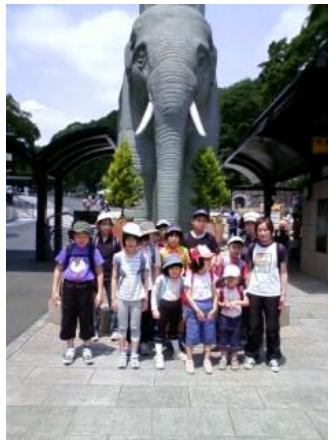
「多摩動物公園だゾー」