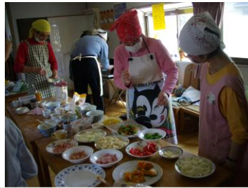
「特製ピザ、どの具にしようかな？」