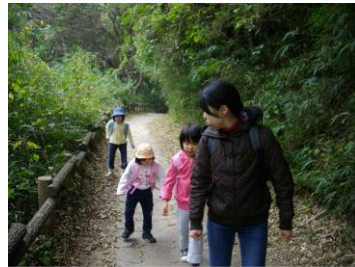
いざ！頂上めざして