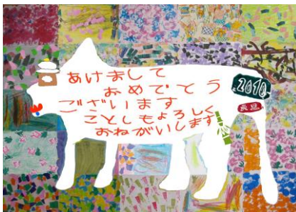
「新年のご挨拶」 トラの”合同作品”です