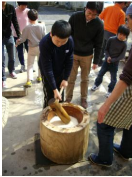
カいっぱいもちついて、 お腹いっぱい食べました