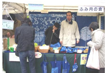
「ステキな藍染め、いかがですかー」