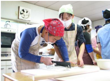
見よ！そば職人の顔つき