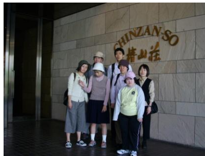
優雅な懐石料理と コンサートを満喫しました

毛糸や布、粘土、色紙な ど様々な材料を使い、い ろいろなクリスマスリ ースを作りました。